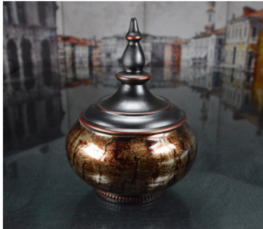
50-074 DECORATIVE GLASS JAR WITH COVER BOCAL EN VERRE DÉCORATIVE AVEC COUVERCLE 15.5"H