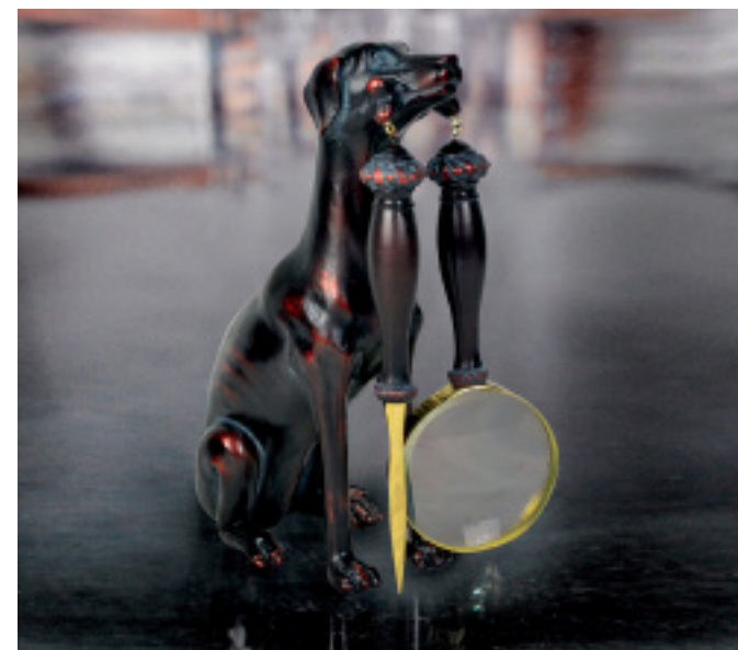
50-070 DOG WITH MAGNIFYING GLASS AND LETTER OPENER CHIEN AVEC LOUPE ET OUVRE LETTRE 10"H