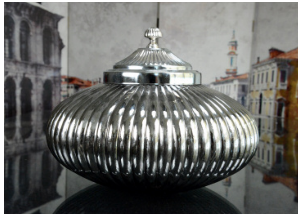
50-077 GLASS CANISTER WITH COVER BOCAL EN VERRE AVEC COUVERCLE 11x8"