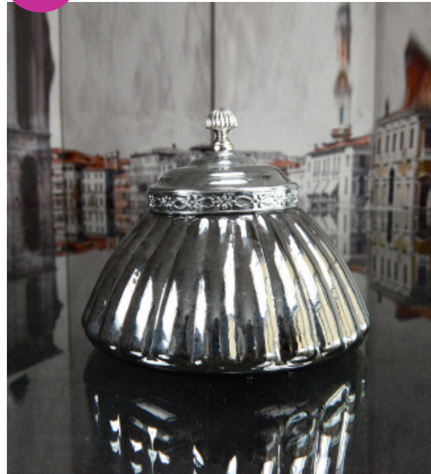
50-075 GLASS CANISTER WITH COVER BOCAL EN VERRE AVEC COUVERCLE 8x7"