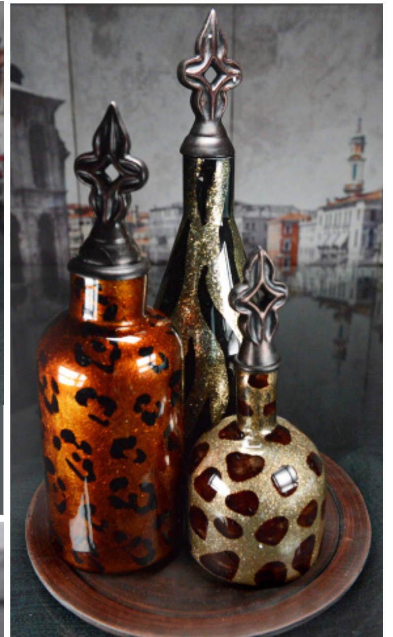
50-068 GLASS VASES - SET OF 3 ON TRAY VASES EN VERRE - ENSEMBLE DE 3 SUR PLATEAU 14.5", 17.75", 23.5"H