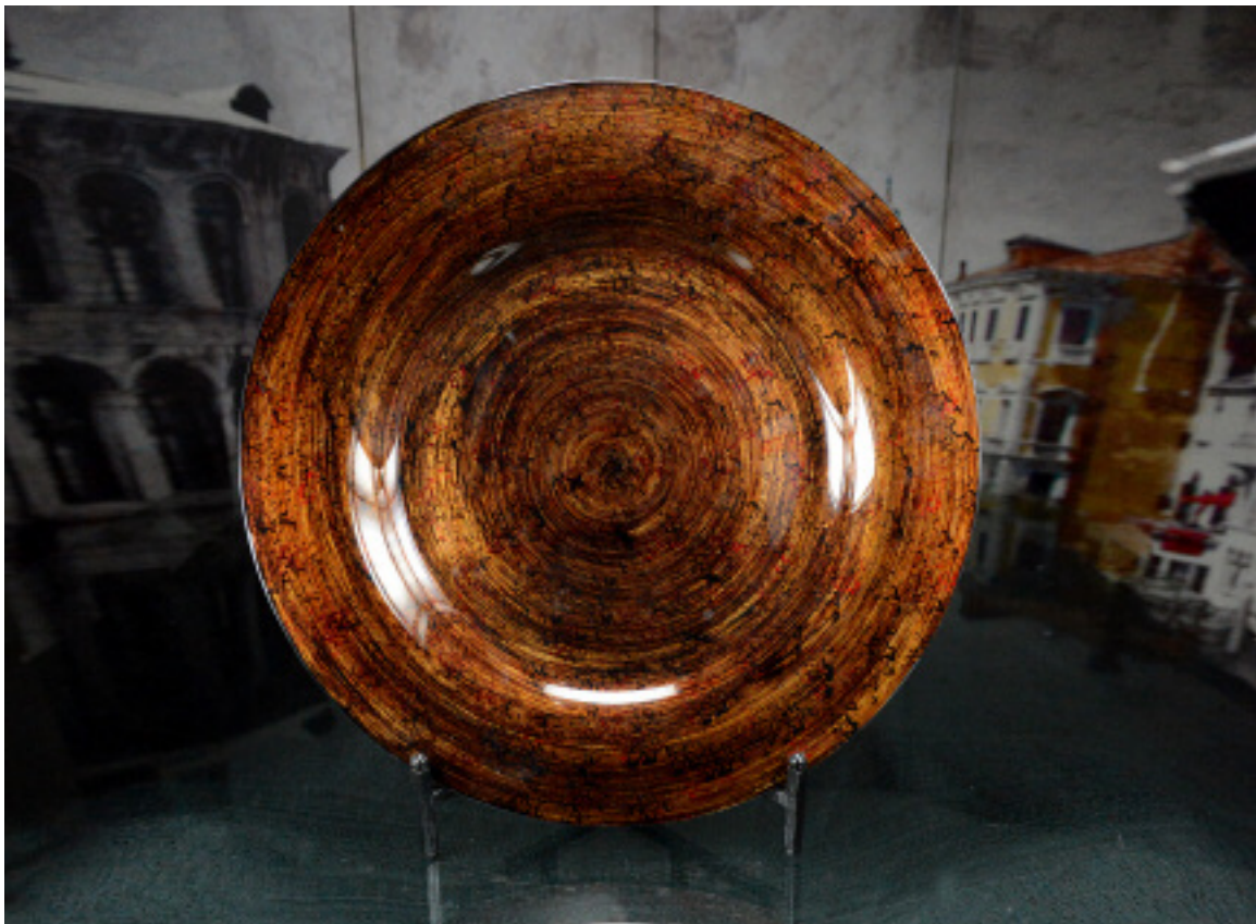
50-073 DECORATIVE GLASS PLATE WITH STAND ASSIETTE EN VERRE DÉCORATIVE AVEC SUPPORT 19"D