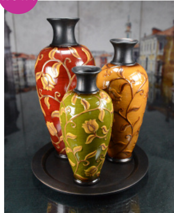
50-069 CERAMIC VASES - SET OF 3 ON TRAY VASES EN CÉRAMIQUE ENSEMBLE DE 3 SUR PLATEAU 10", 11.75", 13.75"H