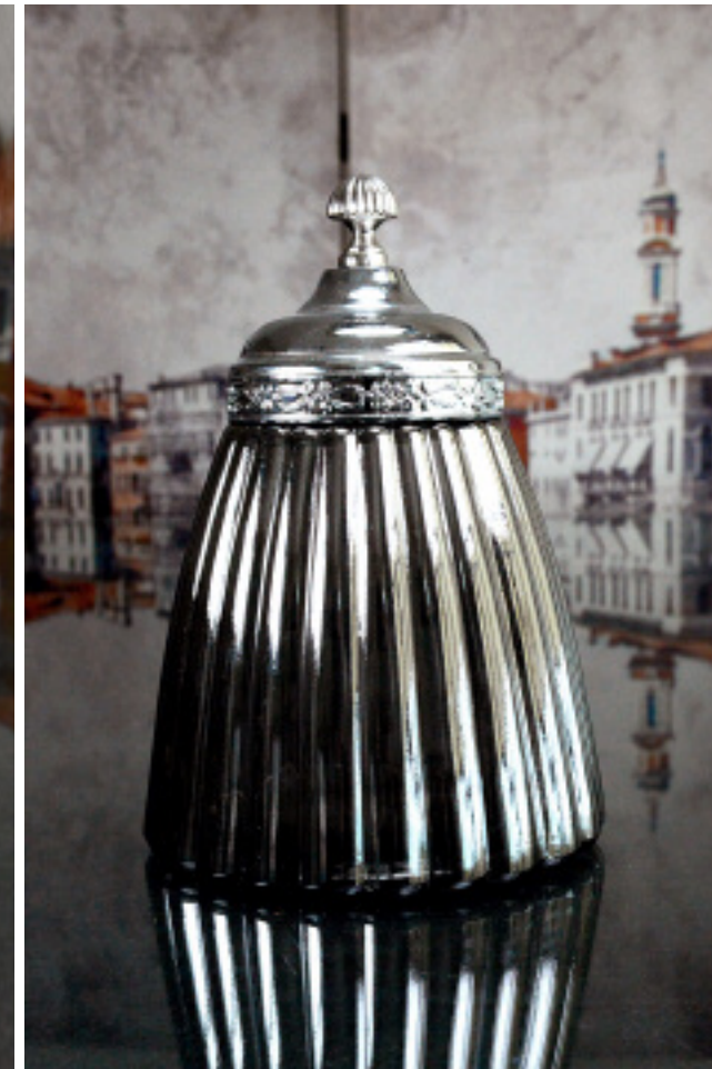
50-076 GLASS CANISTER WITH COVER BOCAL EN VERRE AVEC COUVERCLE 6x9"